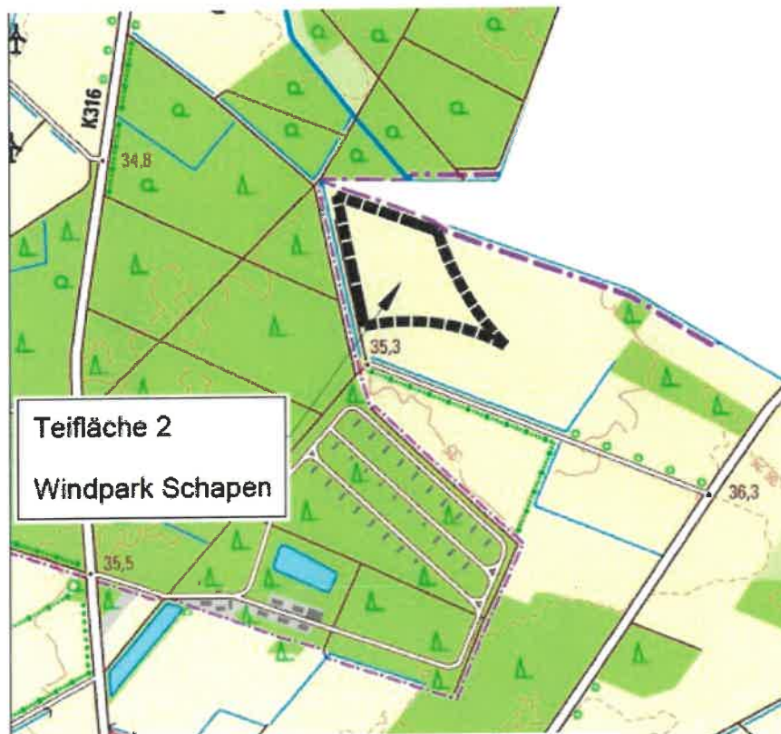
Abbildung 3: Teilfläche 2 in Schapen