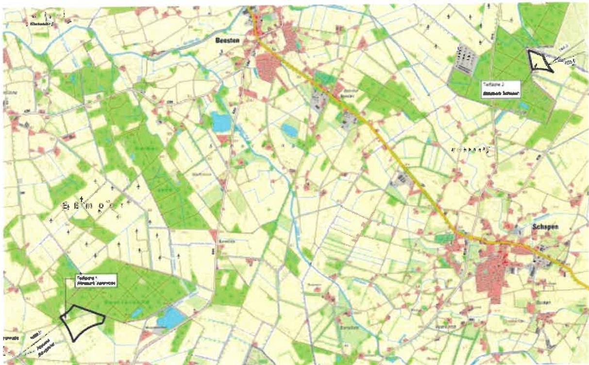
Abbildung 1: Übersichtsplan